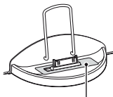
Protection sticker Autocollant de protection Schutzaufkleber